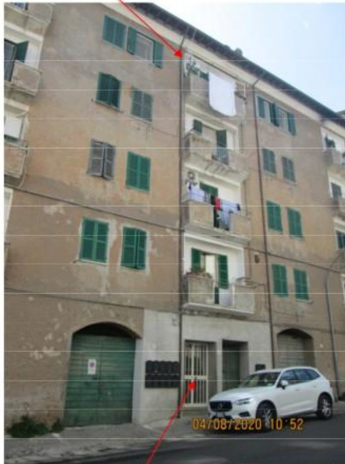
Ingresso Via della Mola n°46